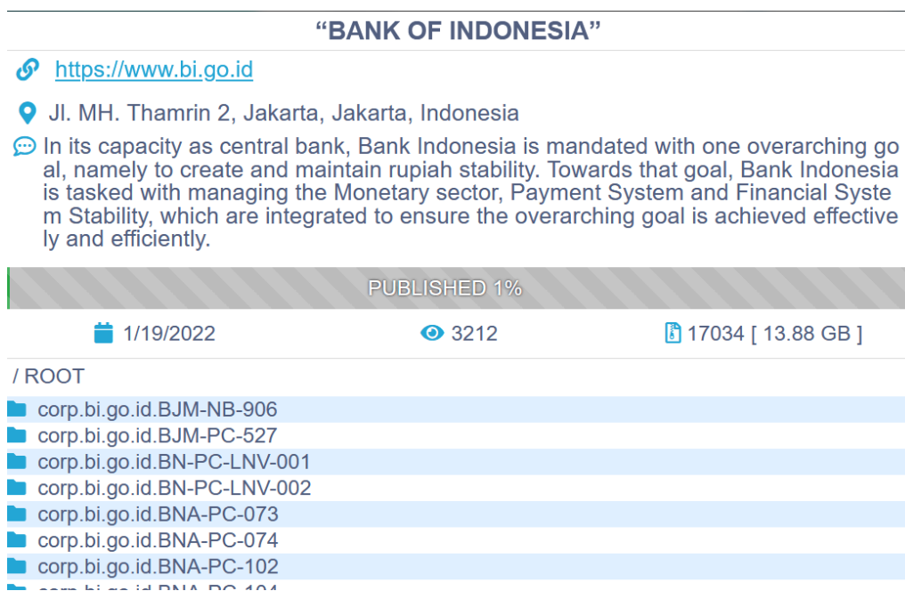
Hình 4: Trang web rò rỉ của Ransomware Conti